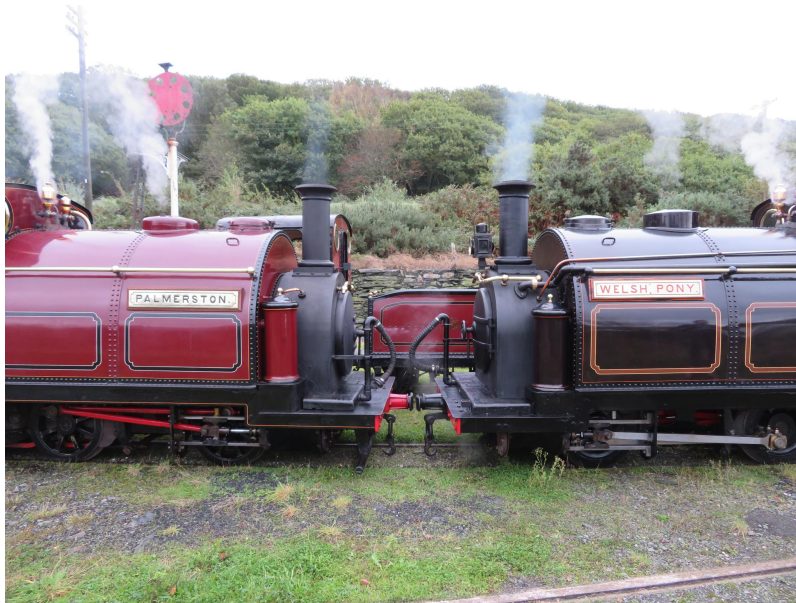
"Welsh Pony" meets "Palmerston" on the FR in 2021.