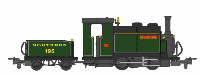
51-251H Large England "Exmoor Pony".

...y otra Small England llegará también.....!