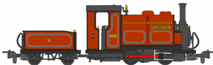
51-251C Small England "Palmerston".